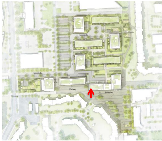
Chora blau Landschaftsarchitekten