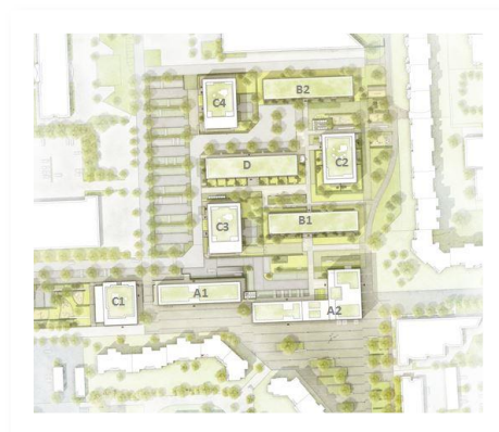
Chora blau Landschaftsarchitekten

Stellplätze in den Außenanlagen und in der geplanten Tiefgarage sollen bei den neuen Mietern und Eigentümern ein sorgenfreies Parken garantieren. Zudem stehen Kurzzeitparkplätze sowie öffentliche Parkplätze in unmittelbarer Nähe zu den Verkaufsf lächen an der Zufahrt zum Neubaugebiet zur Verfügung. Gern können auch zu den Gewerbeflächen in Absprache weitere Stellplätze angemietet werden.