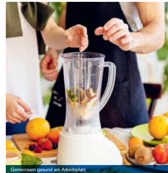
Gemeinsam gesund am Arbeitsplatz

Die Gesundheit und das Wohlbefinden unserer Mitarbeiter sind uns wichtig. Daher schaffen wir Angebote, die diese fördern wie z.B. Workshops mit Tipps zur gesunden Ernährung oder zur Stressbewältigung. Die Nibelungen ist Mitglied bei Hansefit und ermöglicht ihren Mitarbeitern, sich zu günstigen Konditionen fit zu halten und einen sportlichen Ausgleich zum Arbeitsalltag zu finden.