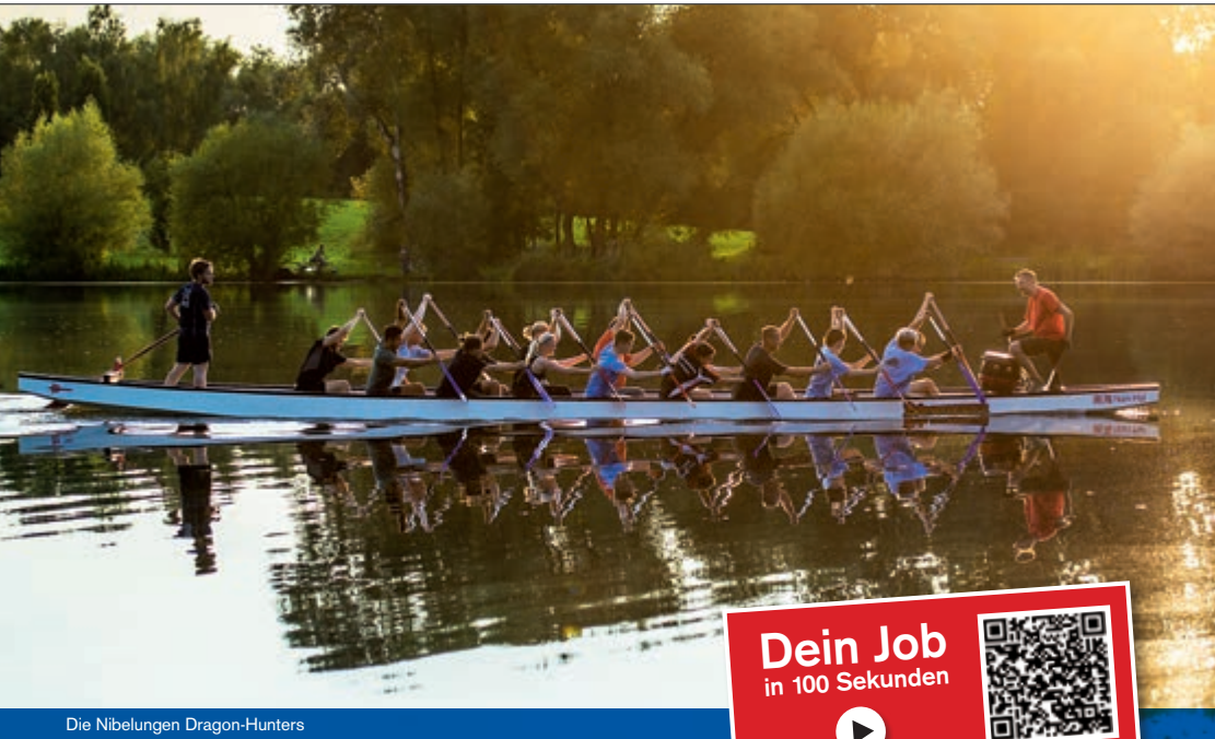
Die Nibelungen Dragon-Hunters