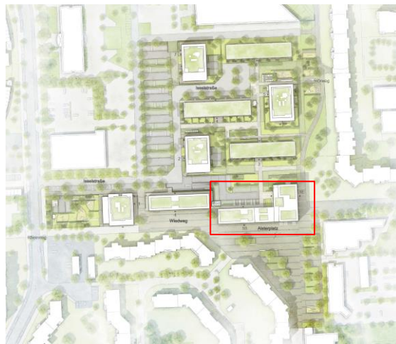
Chora blau Landschaftsarchitekten