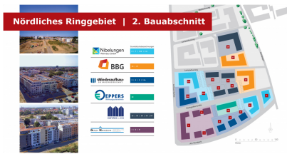
Grafik 2. Bauabschnitt NRG