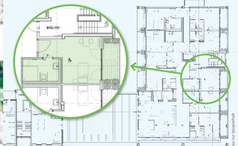
Grundriss nur beispielhaft